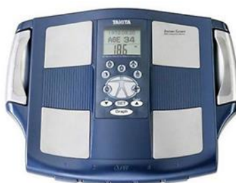
Gambar 1. Tanita Body Composition

Pelaksanaan pengumpulan data yang dilakukan adalah pengambilan data komposisi tubuh dengan menggunakan tes tanita 30.5 didampingi oleh jajaran pelatih dan dokter tim. Teknik pengolahan data dilakukan untuk mengetahui sejauh mana komposisi tubuh pada pemain Borneo FC, maka setelah data yang