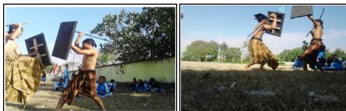
Gambar 4. Pertandingan Peresean

Produk di ujikan kepada kelompok kecil yang terdiri dari 6 (enam) responden tentunya dengan menggunakan produk yang sudah dirancang sebagaimana yang terlihat pada gambar di atas. Berikut ini adalah hasil uji coba: