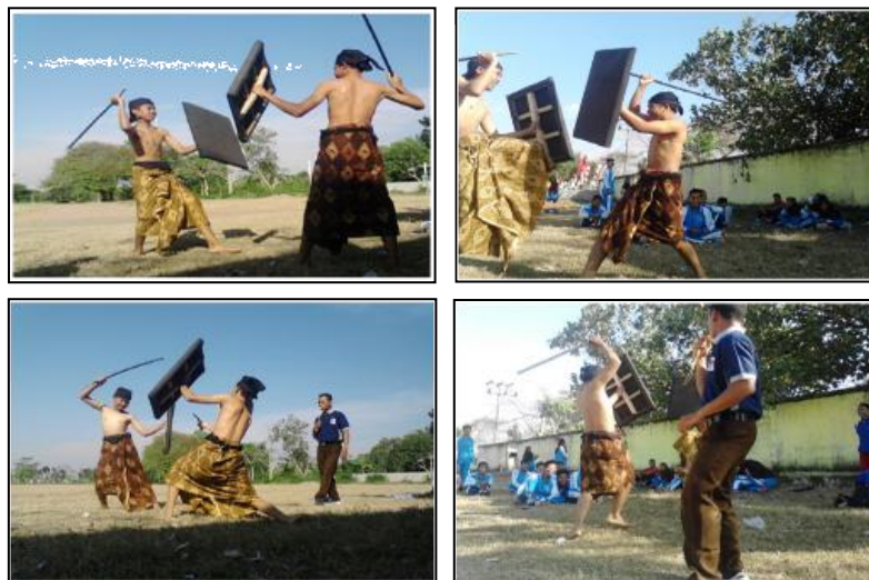
Gambar 7. Pertandingan Peresean

Uji lapangan merupakan uji terakhir pada responden untuk mengabsahkan produk yang sudah direvisi oleh para ahli. Uji lapangan ini berlaku untuk semua responden, akan tetapi diwakili oleh sebagian responden dengan melihat minat responden yang masih kurang atau kurang respon dan responden yang semangat. Berikut adalah gambar responden saat melakukan peresean dengan model yang sudah direvisi, adalah sebagai berikut: