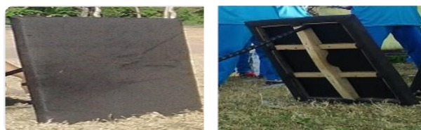
Gambar 1. Tameng atau Ende Tampak Luar dan Dalam yang sudah di modifikasi

Setelah dikomunikasikan dan didiskusikan kemudian dapat menyepakati kesimpulan maka selanjutnya peneliti menampilkan produk persean, Adapun produk rancang tersebut, sebagaimana tertera pada gambar-gambar di bawah ini: