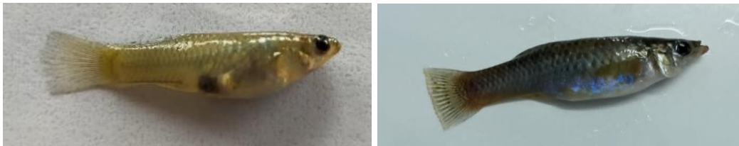
Gambar 4. Ikan Gatul betina. A. Pigmen ikan betina dengan sedikit melanosit (tapak lebih terang); C. pigmen ikan betina dengan banyak melanosit (tampak lebih gelap).