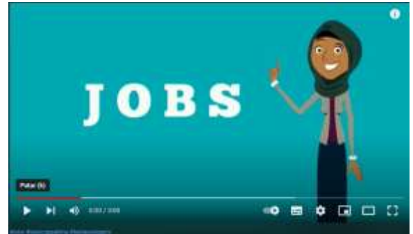
Gambar 1.tampilan aplikasi Powtoon

bagaimana cara pengucapan kosa kata kata Bahasa Inggris yang baik dan benar. Gambar dibawah merupakan tampilan untuk topic Job