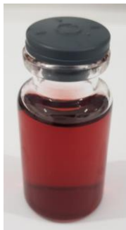
Gambar 1. Koloid Hasil Sintesis AuNp