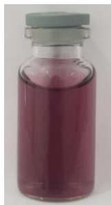
Gambar 3. Koloid AuNp-asam Sialat