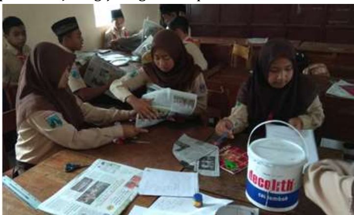
Gambar 2. Pembuatan jaring-jaring tabung dan kerucut

Kegiatan pertemuan kedua siklus satu adalah siswa membuat jaring-jaring tabung dan kerucut sesuai dengan alat peraga yang didapat pada pertemuan pertama. Jaring-jaring dibuat pada kertas koran bekas.