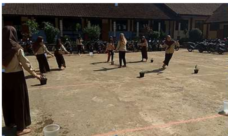
Gambar 5. Permainan memindahkan air

Pada pertemuan kedua di siklus II siswa mengolah data yang telah dikumpulkan di pertemuan pertama sebagai bahan diskusi untuk menjawab pertanyaan-pertanyaan di LAS. Di pertemuan ketiga perwakilan kelompok menyampaikan hasil yang diperoleh di dua pertemuan sebelumnya. Setelah itu siswa mengerjakan tes siklus II.