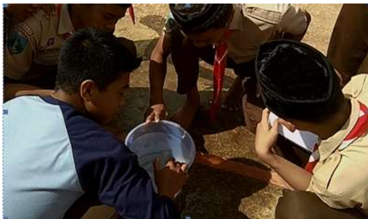
Gambar 4. Pengukuran tinggi air dan diameter tabung

Pada pembelajaran siklus II siswa mengeksplorasi benda nyata yang dibawa dari rumah untuk menjawab pertanyaan terkait volume tabung dan kerucut. Pada pertemuan pertama siswa menggambar sketsa benda yang dibawa pada LAS dan melakukan pengumpulan data dengan melakukan pengukuran benda.