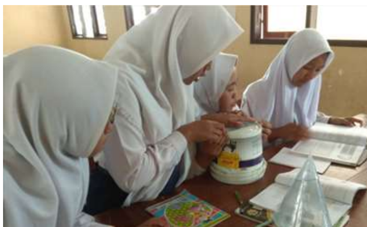
Gambar 1. Pengukuran diameter tabung

Kegiatan pertemuan kedua siklus satu adalah siswa membuat jaring-jaring tabung dan kerucut sesuai dengan alat peraga yang didapat pada pertemuan pertama. Jaring-jaring dibuat pada kertas koran bekas.