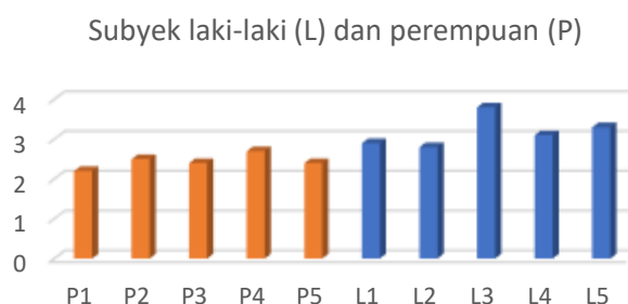
Diagram 3. Grafik Perbandingan Nilai Kemampuan Berpikir Kreatif Pada Aspek Keluwesan

Aspek keluwesan atau flexibility mempunyai kaitan erat dengan kemampuan seseorang ketika memberikan jawaban, alternatif, maupun solusi di luar jawaban pada umumnya. Hal ini dapat diartikan mahasiswa yang memiliki aspek keluwesan tinggi mampu memberikan variasi solusi atau jawaban yang tidak pada umumnya tetapi nilai dari jawaban tersebut adalah benar. Berdasarkan dari penelitian dapat dilihat pada diagram 3 perbedaan nilai rata-rata aspek keluwesan pada perempuan dan laki-laki.