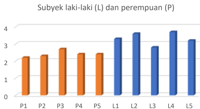
Diagram 2. Grafik Perbandingan Nilai Kemampuan Berpikir Kreatif Pada Aspek Kelancaran

Berdasarkan diagram 2 terlihat adanya perbedaan nilai rata-rata antara subyek perempuan dan laki-laki. Nilai rata-rata lebih dari tiga pada aspek kelancaran terlihat dari empat laki-laki, sedangkan pada semua perempuan nilai rata-ratanya kurang dari 3. Data nilai rata-rata pada aspek kelancaran kemudian dianalisis dengan uji-t dengan taraf signifikansi 5% terlihat dari tabel 2.