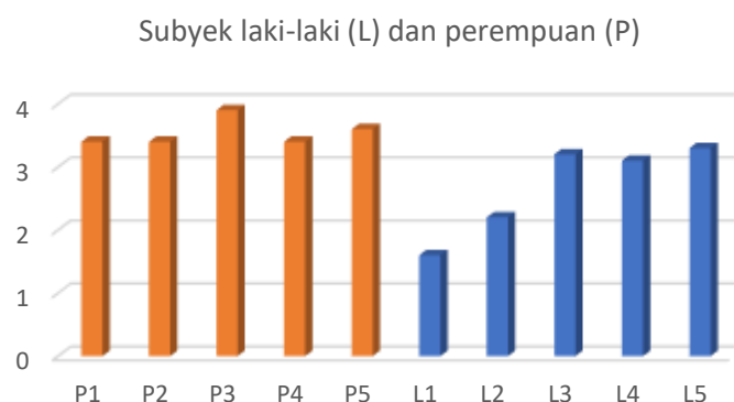
Diagram 5. Grafik Perbandingan Nilai Kemampuan Berpikir Kreatif Pada Aspek Elaborasi

Aspek elabolasi atau elaboration berkaitan dengan kemampuan mahasiswa dalam mentransformasikan gagasan-gagasan maupun ide dalam bentuk yang lebih detail. Secara umum aspek elaborasi membutuhkan kemampuan yang mampu merinci atau membuat detail rincian tersebut. Berdasarkan hasil penelitian dapat dilihat pada diagram 5 adanya perbedaan nilai rata-rata aspek elaborasi baik perempuan maupun laki-laki.