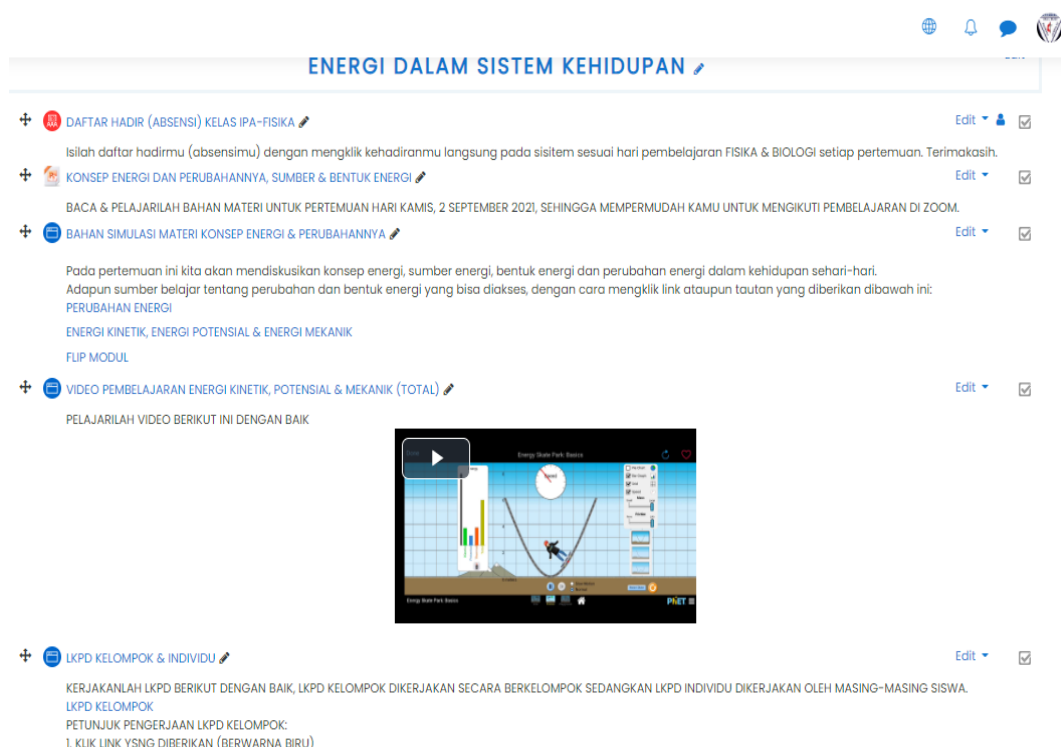
Gambar 1. Pemanfaatan Fitur Moodle untuk Pembelajaran Interaktif

Pemanfaatan learning management system dengan moodle di SMP Methodist 8 Medan dilakukan dengan berusaha memanfaatkan fitur-fitur yang ada pada moodle untuk membangun pembelajaran interaktif saat pembelajaran daring berlangsung. Pemanfaatan fitur file, page, quiz, book, assignment dan sebagainya dapat menyediakan kegiatan pembelajaran yang bervariasi untuk mengatasi kebosanan peserta didik yang selama ini melakukan kegiatan pembelajaran yang monoton dalam pembelajaran daring. Berdasarkan hasil observasi dan dokumentasi pembelajaran daring menggunakan moodle seperti pada gambar 1, penggunaan fitur-fitur dalam moodle dapat mempertahankan semangat dan antusias belajar sebagian besar peserta didik dalam pembelajaran daring. Pemanfaatan fitur page dalam mengintegrasikan moodle ke sistem/website lain seperti pada gambar 2, penggunaan LKPD dan kuis interaktif masing-masing dalam live worksheet dan quiz dapat meningkatkan antusias/semangat dan aktivitas belajar siswa.