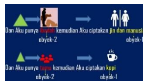
Gambar 2. Analogisme Kalimat Negasi

Frasa kata dari tidak aku ciptakan identik antara kalimat yang diteliti atau kalimat pertama dengan kalimat analogisme atau kalimat kedua. Obyek 1 pada kalimat pertama yaitu jin dan manusia diganti dengan kopi pada kalimat kedua. Kata negasi kecuali untuk antara kalimat ke-1 dan ke-2 identik atau tidak ada perubahan. Perubahan terjadi pada obyek 2 pada kalimat pertama yaitu kata ibadah yang berganti menjadi kata tamu. Semua obyek dalam kalimat pertama dan kedua dikategorikan sebagai kata benda, walaupun ibadah dapat dikategorikan sebagai kata kerja. Urgensi dari penyamaan semua obyek ini ke dalam kata benda bertujuan untuk melihat urutan prioritas dalam kalimat.